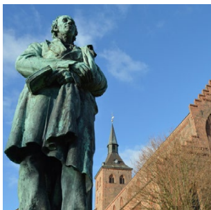
H.C. Andersens statue bag Skt. Knuds Domkirke ved Odense Å.

HC Andersen levede og skrev i en tid, hvor mange nye ting og fænomener brød frem. Dampmaskinen blev almindelig, elektromagnetismen og med den telegraf blev dele af virkeligheden. Folkestyret udviklede sig. En række gamle, stive strukturer